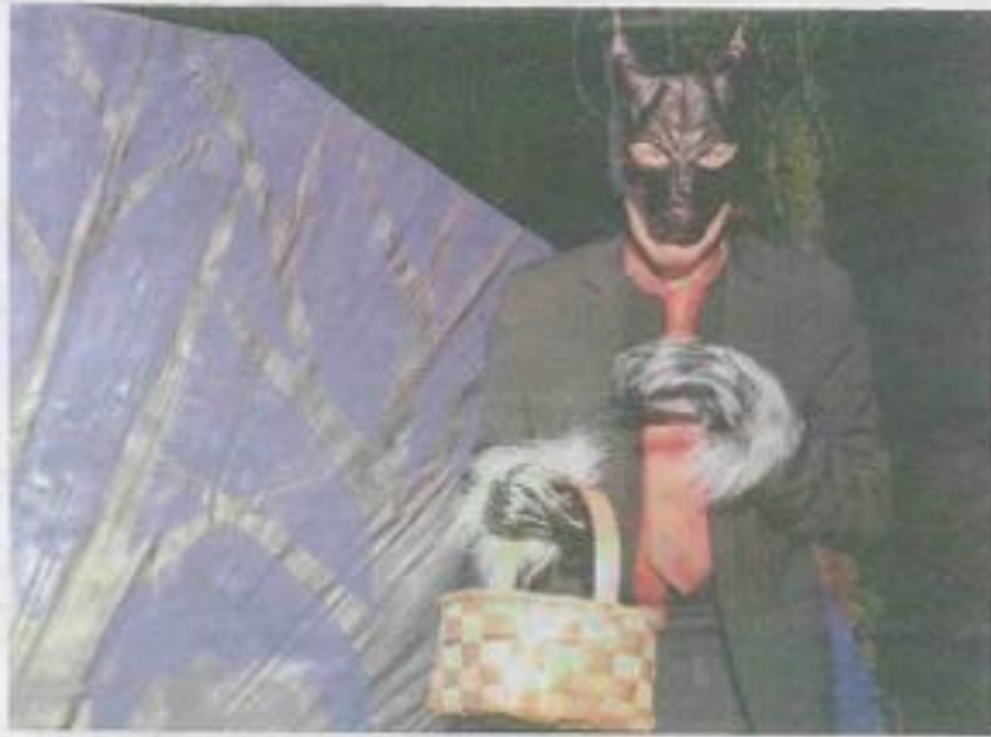
Les premières versions du conte remontent au 1 er siècle. >>>>>

« C'est joyeux, drôle et poétique avec une mise en scène envoiée, ce qui n'empêche pas d'aborder des thèmes plus profonds », observe cette ancienne spécialiste des voix off.