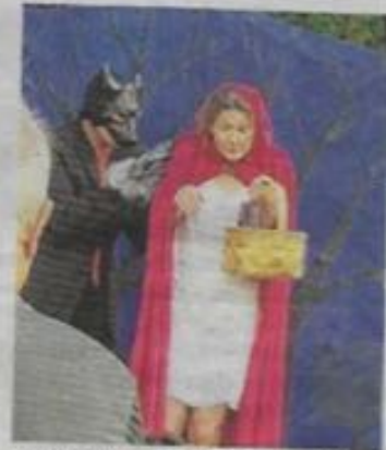
Le Petit Chaperon rouge et le grand méchant loup. >>>>>

À l'occasion des animations estivales, le moulin du duellias situé à Saint-Martial d'Artenset, a accueilli la compagnie Bois & Charbon qui est venue présenter leur nouvelle création, « L'histoire vraie du petit chaperon rouge », vendredi 12 juillet. C'est devant un public composé de plus d'une centaine de spectateurs que cette compagnie a joué sa propre version du célèbre conte qui s'inspire des versions médiévales. À la fin du spectacle, les spectateurs ont pu échanger avec les comédiens sur l'évolution de ce conte à travers les siècles, les modifications qui ont été apportées par les différents auteurs, ou encore la place et l'importance de chaque personnage au fil des versions.